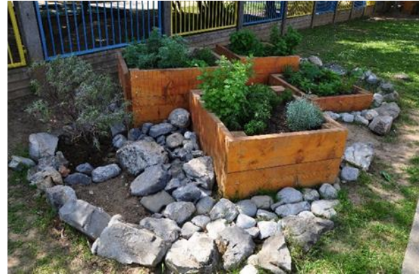
Slika 2: Končna podoba zeliščnega vrta