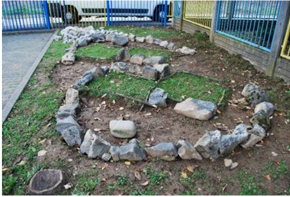
Slika 1: Zasnova zeliščnega vrta